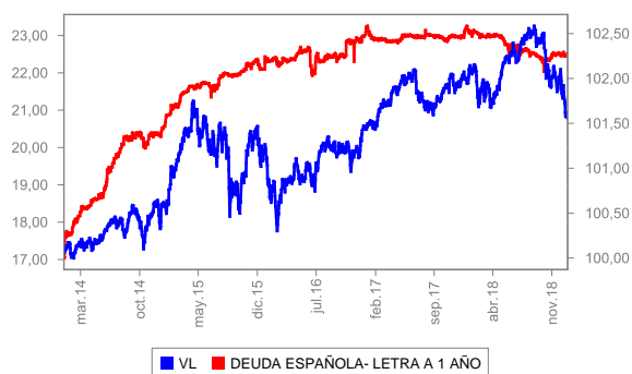
Evolución del valor liquidativo últimos 5 años