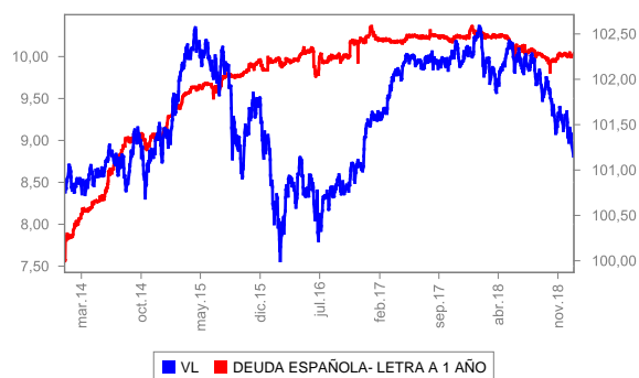
Evolución del valor liquidativo últimos 5 años